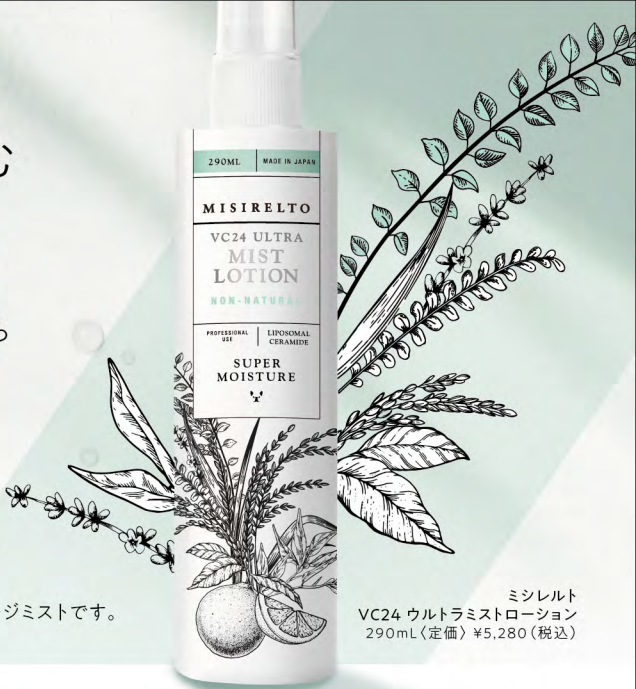
ミシレルト VC24 ウルトラミストローション 290mL(定価) ¥5,280(税込)

肌に触れた回数だけ、肌はダメージを蓄積していくから。 肌に触れないスキンケアこそ、やさしさとダメージレスを追求したケアの形。 「ミシレルトVC24 ウルトラミストローション」はシュッとひと吹きするだけで、 超微粒子のミストが目には見えない毛穴の凹凸にまでピタッと密着し、 ビタミンCとセラミドの保湿の膜で肌を包み守ります。 肌摩擦0でマイナスコンディションのときも頼りになる、浴びるようにたっぷり使える瞬間チャージミストです。