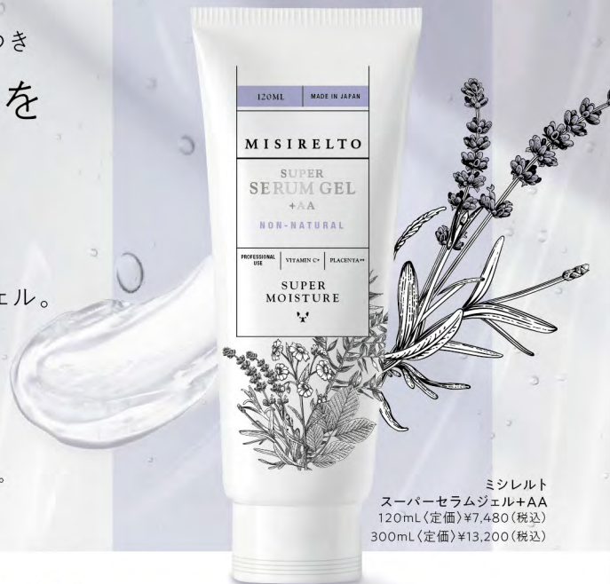
ミシレルト スーパーセラムジェル+AA 120mL(定価)¥7,480(税込) 300mL(定価)¥13,200(税込)

肌をダメージから守るケア、潤いを与えるケア、トラブルを寄せ付けない肌に育てるケア。 肌が求めていることを1本に集約し、肌摩擦の心配なく、6つの悩みをケアします。